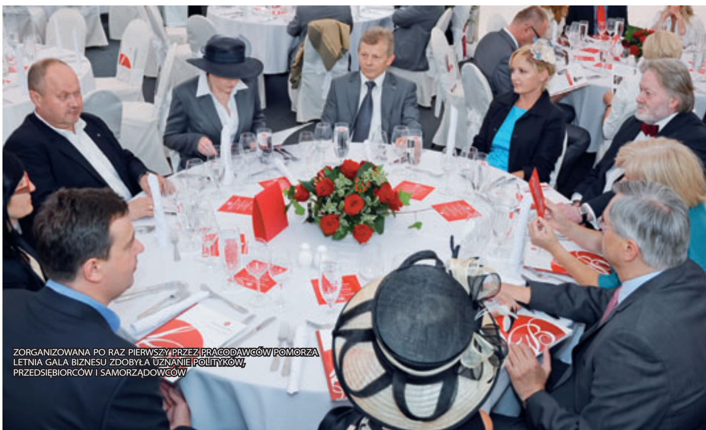
ZORGANIZOWANA PO RAZ PIERWSZY PRZEZ PRACODAWCÓW POMORZA LETNIA GALA BIZNESU ZDOBYŁA UZNANIE POLITYKÓW, PRZEDSIĘBIORCÓW I SAMORZĄDOWCÓW

Organizatorzy dziękują: Energa, Alior Bank, Polservice Development, Pomorska Specjalna Strefa Ekonomiczna, Węglokoks, Pomorska Spółka Gazownictwa, Nordea, Chipolbrok, Interbalt Patronat medialny: TVP Gdańsk, Radio Gdańsk, Dziennik Bałtycki, Trójmiasto.pl