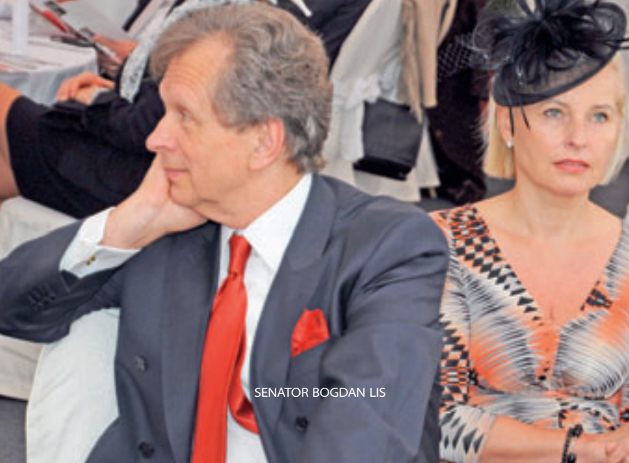
SENATOR BOGDAN LIS