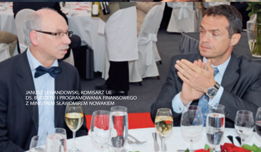
JANUSZ LEWANDOWSKI, KOMISARZ UE DS. BUDŻETU I PROGRAMOWANIA FINANSOWEGO Z MINISTREM SŁAWOMIREM NOWAKIEM