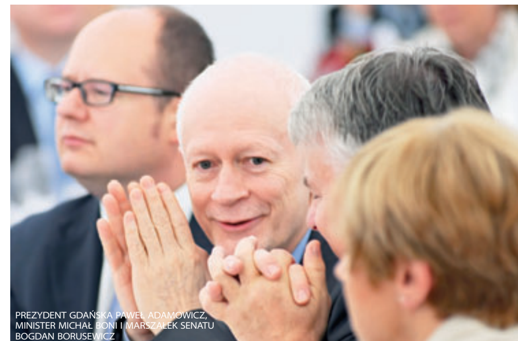
PREZYDENT GDAŃSKA PAWEŁ ADAMOWICZ, MINISTER MICHAŁ BONI I MARSZAŁEK SENATU BOGDAN BORUSEWICZ

Także w tym roku w czasie Letniej Gali Biznesu Pracodawcy Pomorza przyznali trzy nagrody specjalne. W kategorii instytucja nagrodę „Odwaga i Roztropość” otrzymał Narodowy Bank Polski za obronę wartości polskiego pieniądza. Nagroda została przekazana na ręce prezesa NBP Marka Belki. W kategorii minister nagrodą „Dialog Ponad Wszystko” wyróżniony został Michał Boni, u którego doceniono profesjonalizm i wytrwałość w dialogu z różnymi środowiskami i grupami zawodowymi. W kategorii samorządowiec nagrodę „Wiatr w Żagle” otrzymał Paweł Adamowicz (za konsekwencję i determinację w przygotowaniu i rozpoczęciu wielkiej modernizacji Gdańska).