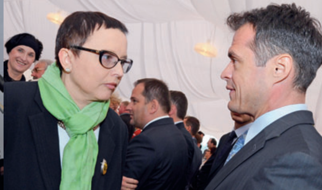
MINISTER EDUKACJI NARODOWEJ, KATARZYNA HALL W ROZMOWIE ZE SŁAWOMIREM NOWAKIEM, SEKRETARZEM STANU W KANCELARII PREZYDENTA