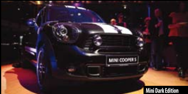
Mini Dark Edition

P ołączenie unikalnej motoryzacji i wyjątkowej biżuterii – tak można w skrócie podsumować prezentację limitowanej wersji Mini Dark Edition, która odbyła się w sopockim klubie Atelier. Prezentacji towarzyszył pokaz luksusowej biżuterii światowych projektantów z butiku Kate & Kate oraz ubrań MMC Studio Design. Designersko, luksusowo, temperamentnie i przede wszystkim mrocznie. Tak prezentuje się nowe Mini w czarnej wersji. Na pewno spodoba się ono tym, którzy szukają samochodu niepowtarzalnego, a przy tym sami są indywidualistami lubiącymi się wyróżniać. jj