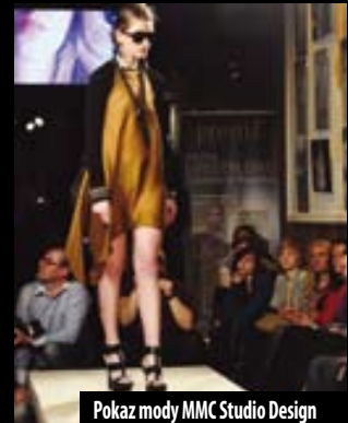
Pokaz mody MMC Studio Design