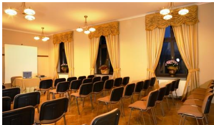
Sala konferencyjna A