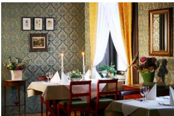
Sala restauracyjna „Zielona”

PRZY REZERWACJI CO NAJMNIE 5 NOCLEGÓW, SALA JUŻ ZA 100 zł.