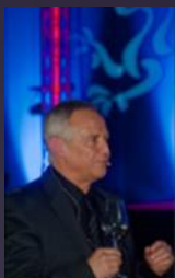
Marek Kondrat 2013

Wyjątkowy charakter naszej Gali podkreślają specjalnie zaproszeni goście z przestrzeni biznesu i kultury.