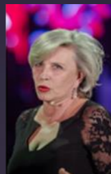
Krystyna Janda 2015