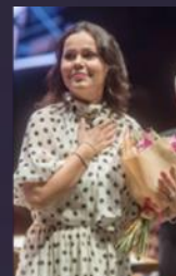
Aleksandra Kurzak 2021