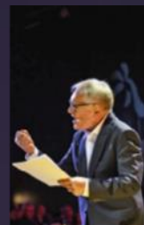
Andrzej Seweryn 2020