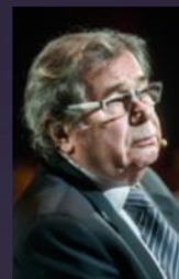
Janusz Gajos 2017