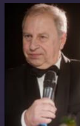
Jerzy Stuhr 2018