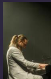
Leszek Możdżer 2019