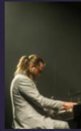
Leszek Możdżer 2019