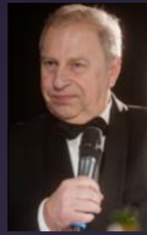
Jerzy Stuhr 2018