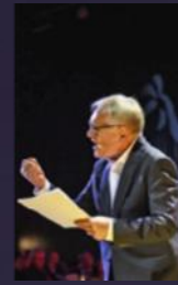
Andrzej Seweryn 2020