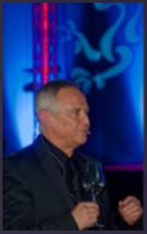
Marek Kondrat 2013