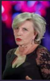
Krystyna Janda 2015