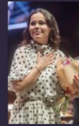
Aleksandra Kurzak 2021