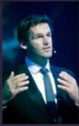
Mateusz Kusznierewicz 2014