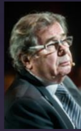
Janusz Gajos 2017