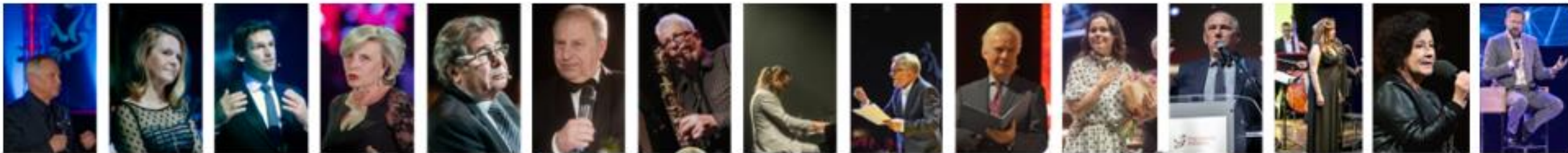
Marek Kondrat 2013