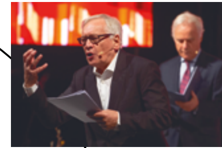
PROF. JERZY LIMON ANDRZEJ SEWERYN 2020