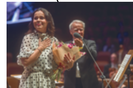
ALEKSANDRA KURZAK 2021